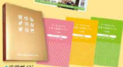
▲応援ガイド 発行済み冊子の全データを公開 (ブログ・インスタグラムでご案内)