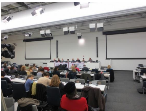
2013年 記念会議の様子

スピーチ内容：ダウン症の書道家として成功するまでの自身の経験と、日本文化を代表する書道の魅力を会議のテーマに合わせて紹介。